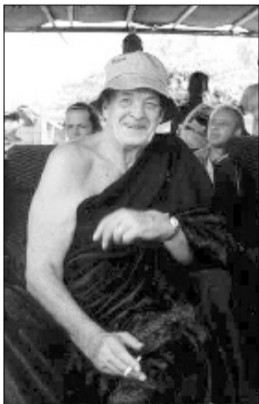
Strekker tiden til for Erik Bye, dukker også han opp under sjøsettingen.

– Men dette høres virkelig interessant ut, fortsetter Bye. Brønnøysunds Avis må be narvikmannen sende papirene på nytt på telefax. Jeg kan jo ikke her og nå love at jeg dukker opp i Alslia under sjøsettingen. Men jeg kan love at strekker tiden til, så vil jeg prioritere en reise til Bindal, sier Erik Bye.